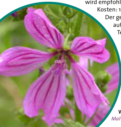
Wilde Malve Malva sylvestris