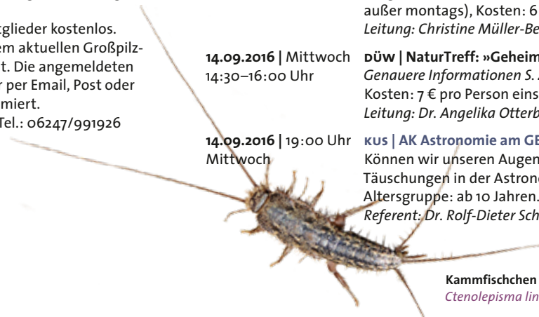
Kammfischchen Ctenolepisma lineata