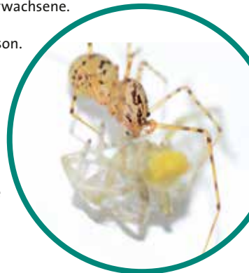
Speispinne Scytodes thoracica