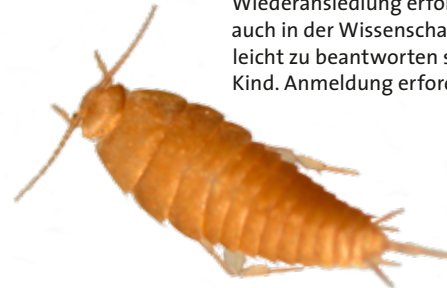
Ameisenfischchen Atelura formicaria

In diesem Jahr werden die ersten Luchse im Pfälzerwald ausgewildert. Doch wie viele Luchse können eigentlich im Pfälzerwald leben, was bedeutet das für die Menschen, die dort wohnen, und wie wird kontrolliert, ob die Wiederansiedlung erfolgreich ist? Wir beschäftigen uns mit den Fragen, die auch in der Wissenschaft und im Naturschutz interessant und nicht immer leicht zu beantworten sind. Für Jugendliche von 10–14 Jahren, Kosten 8 € pro Kind. Anmeldung erforderlich unter 06322/9413-21 (täglich außer montags).