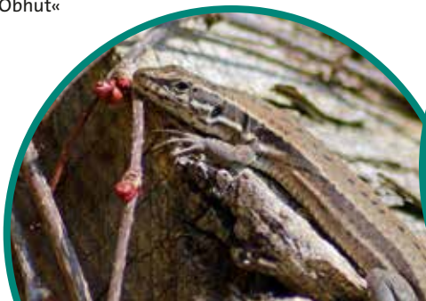
Mauereidechse Podarcis muralis