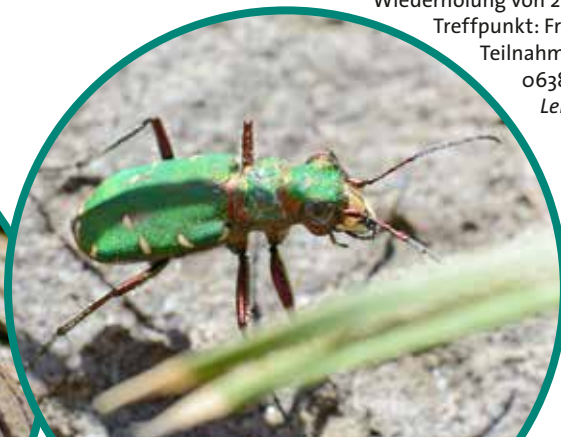
Feld-Sandlaufkäfer Cicindela campestris