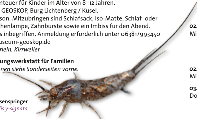
Felsenspringer Lepismachilis y-signata

DÜW | Offene Forschungswerkstatt für Familien Genauere Informationen siehe Sonderseiten vorne.