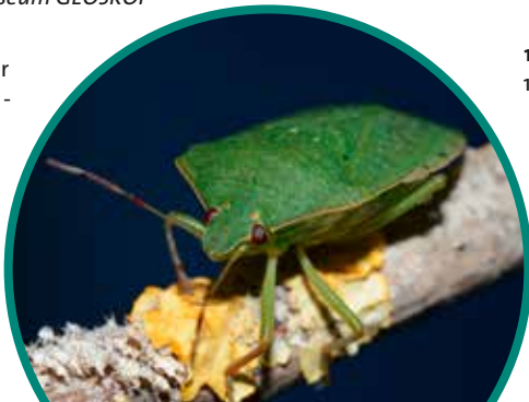
Baumwanze Nezara viridula

DÜW | VFMG Bezirksgruppe Pfalz »Grillfest im Hof des Pfalzmuseums für Naturkunde mit Mineralien-/Fossilien - Kauf/Tauschmöglichkeit«