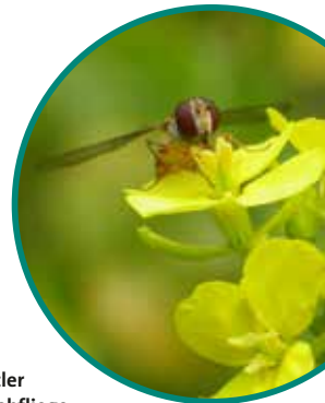
Kreuzblütler mit Schwebfliege