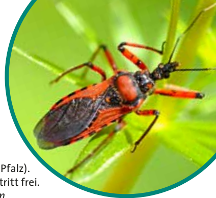
Rote Mordwanze Rhynocoris iracundus