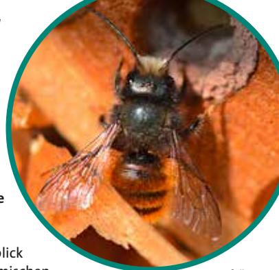
Gehörnte Mauerbiene Osmia cornuta