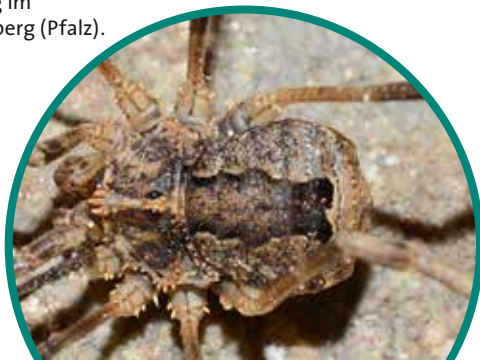
Weberknecht Odiellus spinosus

düw | Interessengemeinschaft Pilzkunde und Naturschutz e.V. »Pilzkundliche Lehrwanderung im Raum Bad Dürkheim« Diese Veranstaltung dient nicht in erster Linie dem Zweck, mitgebrachte Körbe mit Speisepilzen zu füllen. Sie soll vielmehr das Wissen über die heimische Pilzflora und die ökologische Rolle der Pilze in unserer Natur vermitteln. Darüber hinaus kann man auf dieser Lehrwanderung aber auch viel über das sichere Erkennen und Sammeln von Speisepilzen lernen. Eine frühzeitige Anmeldung wird empfohlen, da die Teilnehmerzahl begrenzt ist. Die angemeldeten Teilnehmer werden ca. 4-5 Tage vor der Veranstaltung über den Treffpunkt im Raum Bad Dürkheim informiert, nachdem dieser nach dem aktuellen Großpilzaufkommen festgelegt wurde. Kosten: 10 € pro Person, Jugendliche 5 €, für IPN-Mitglieder kostenlos. Anmeldung: ingrid.keth@ipn-ev.de oder Tel.: 06247/991926.