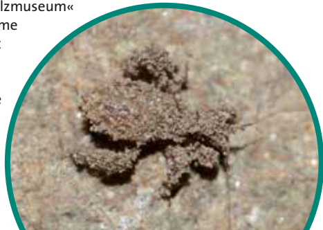
Staubwanze Reduvius personatus