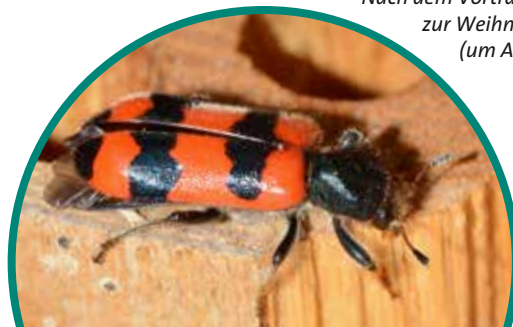
Gemeiner Bienenkäfer Trichodes apiaris