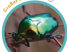
Großer Rosenkäfer 5