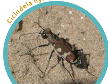
Cicindela hybrida ②