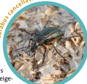
Carabus cancellatus ④

Der Familiensonntag für Familien mit Kindern ab 7 Jahren steht ganz im Zeichen des Papiers. Es gibt Informationen, Geschichten und Aktionen zur Geschichte und Herstellung des Papiers und natürlich bekommen alle die Chance einen eigenen Bogen Papier zu schöpfen. Kosten: 8 € pro Person. Anmeldung erforderlich unter 06322/9413-21 (tgl. außer montags)