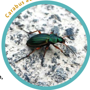
Carabus auratus ①